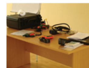
Blower door test mjeri propusnost vazduha kroz ometač objekta.

U 2012. godini 720 osoba sa područja oba entiteta i Brčko distrikta BiH učestvovalo je u teoretskim i praktičnim treninzima i obukama iz oblasti energetske efikasnosti sprovedenim od strane Centra za održivi razvoj. Kao dio praktičnog treninga izvršeno je unapređenje energetske efikasnosti 22 stambena objekta iz kategorije socijalno ugroženih familija.