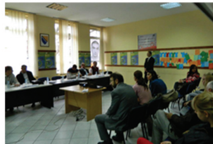
Forum projekta „Mladi u eko sektoru“