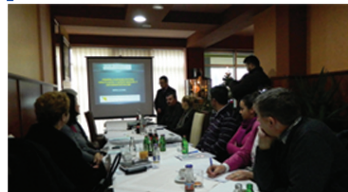
Okrugli sto na temu problematike očuvanja životne sredine.

Zalažemo se za integrisanje održivog razvoja u planove ekonomskog, društvenog i privatnog sektora. Svjesni smo da ne radimo sami, tako da bi održivi razvoj postao realnost u Bosni i Hercegovini, cilj nam je da se povežemo sa drugim organizacijama, vladama i lokalnim zajednicama, stvarajući savez za održivi razvoj u BiH. U našim nastojanjima, podizanje javne svijesti je od suštinske važnosti. Izuzetno je važno da se javnost više uključi u proces održivog razvoja. Nadamo se da će svaki građanin, građanska organizacija i javna ustanova sarađujući sa nama usvojiti barem neke od principa održivog razvoja. U svakom od naših projekata je ugrađena komponenta podizanja svijesti građana i institucija, a kao organizacija koristimo tradicionalne i socijalne medije na podizanju svijesti.