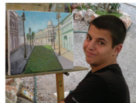
Kurs crtanja i slikanja.