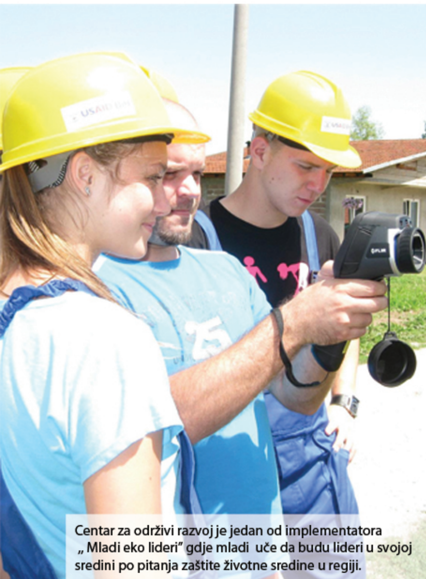
Centar za održivi razvoj je jedan od implementatora „Mladi eko lideri” gdje mladi uče da budu lideri u svojoj sredini po pitanja zaštite životne sredine u regiji.

C entar za održivi razvoj je svjestan da su mladi ljudi izvor energije i preduslov pozitivnih promjena u društvu. Mnogi od njih su nezaposleni, bez volje i prilike da se aktiviraju i urade nešto za sebe i svoju zajednicu. Mi radimo na osposobljavanju, edukaciji i prije svega nužnom aktiviranju mladih ljudi u zajednici. To se ogleda kroz razne treninge i radionice u kojima se kombinuje opšta i specifična edukacija, priprema za posao, te razni tehnički treninzi.