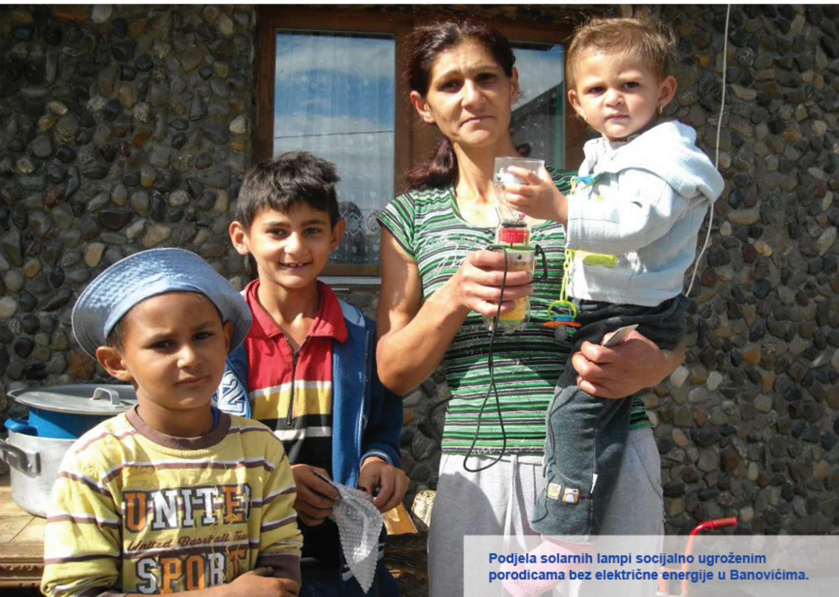
Podjela solarnih lampi socijalno ugroženim porodicama bez električne energije u Banovićima.